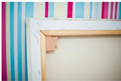
Beata Klepaczewska FOTOGRAFIA